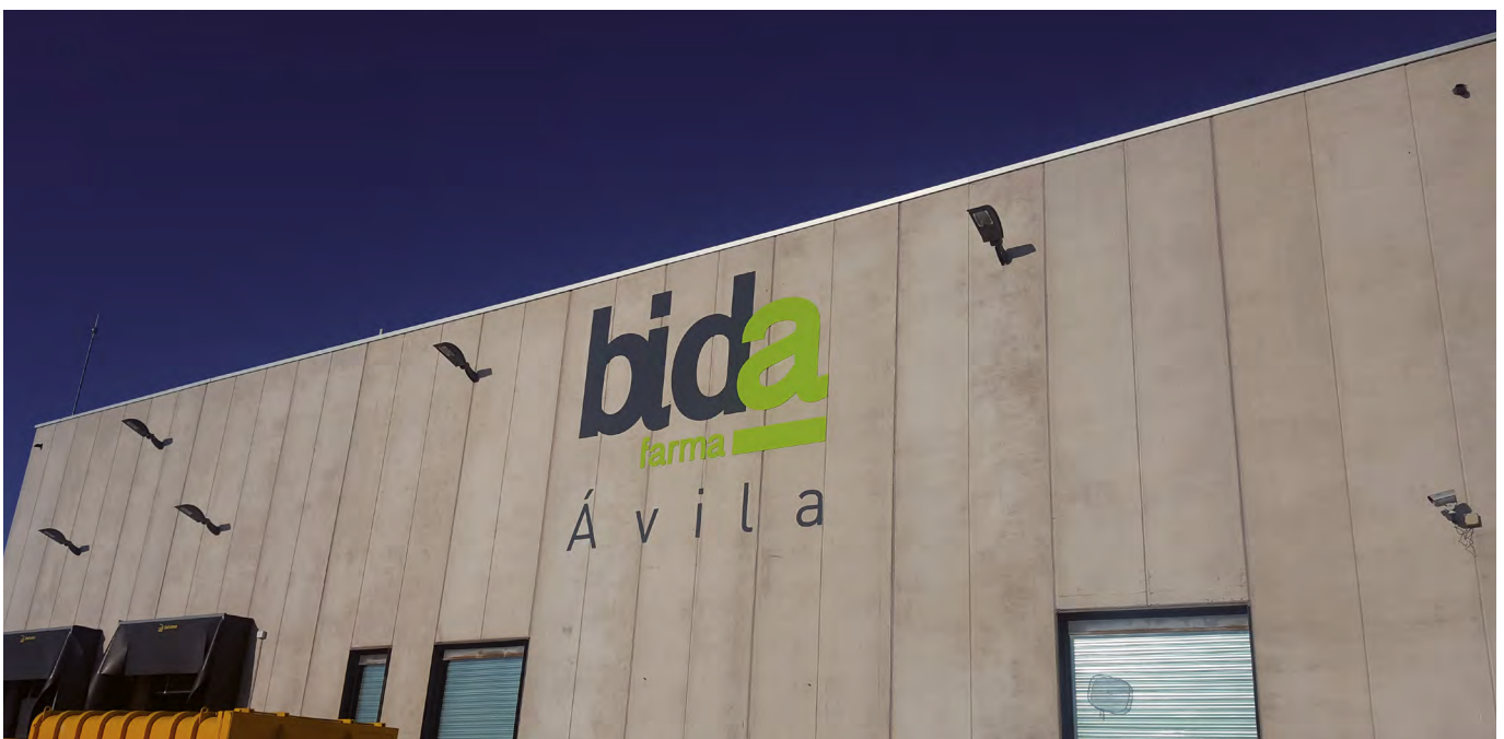
Imagen exterior del nuevo rotulado del almacén de Ávila.

En una primera fase se rotuló la fachada principal con el logotipo y colores institucionales con nuestra slogan "Somos cooperativa, somos farmacia" y vinilos en el interior. Además se rotuló la parte trasera que es la mas visible desde todas las entradas a Ávila.