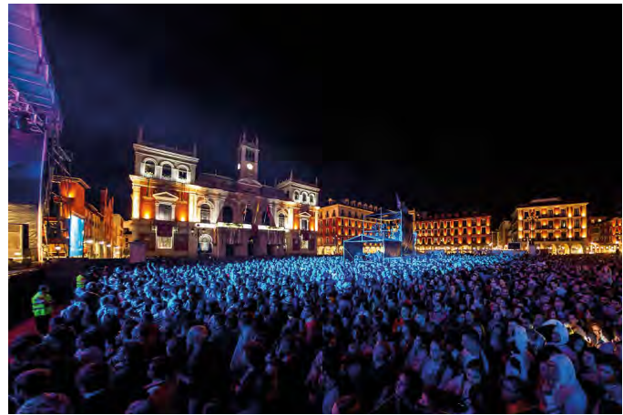
Miles de vallisoletanos en la Plaza Mayor durante uno de los conciertos que se celebran en los días de fiesa de la capital.

Multitud de contenidos para todo tipo de edades e intereses y, como cada año, el acogimiento fue masivo. Entre estos contenidos se pudo disfrutar de: conciertos con los principales artistas nacionales del momento, teatro, atracciones, pirotecnia, degustaciones gastronómicas, exhibiciones artesanales, magia, verbenas populares, desfile de peñas, demostraciones de bailes folclóricos y hasta un encuentro de Harley Davison para los mas moteros.